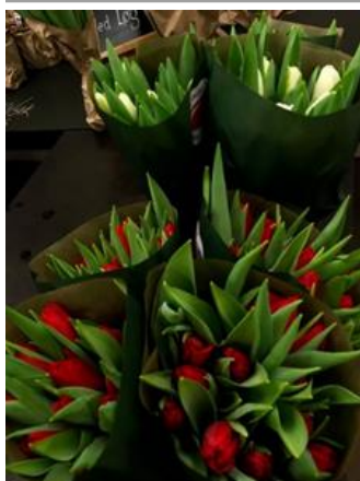
Røde, hvide, lilla til jul .....

Se: Tips om løgblomster på www.tulipangaarden.com