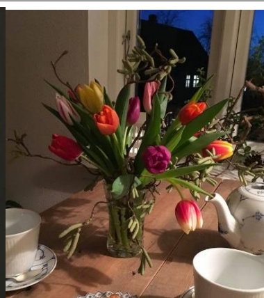
... flere sorter til nytår